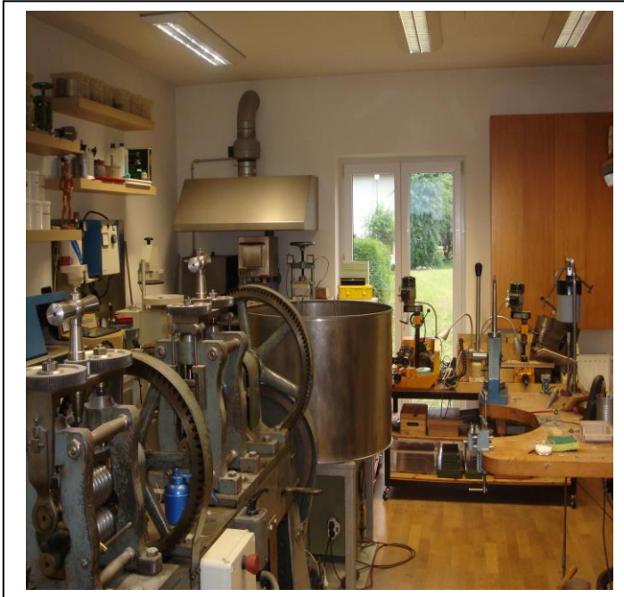
kunstschaffende/r bei der arbeit