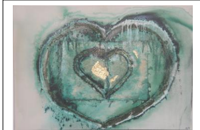
Aus Herzyklus: Öl, Acryl, Tusche mit Gold